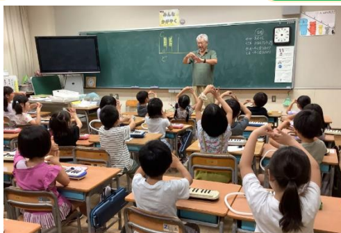
1年鍵盤ハーモニカ教室 7/10 鍵盤ハーモニカの使い方を楽しく教わりました。