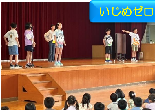
運営委員会「いじめゼロ劇」 7/5 運営委員会が「いじめをゼロに！」の思いで劇を創り、全校に呼びかけました。