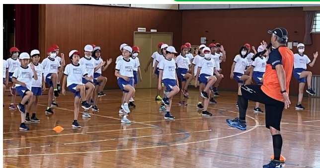
5・6年陸上教室 7/17 アルビレックスランニングクラブの講師から走り方を教わりました。陸上記録会の選手は、さらにその後も指導してもらいました。