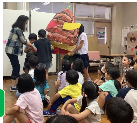
たけのこまつり 7/17 たけのこ学級の子もたちがお祭りを企画して、1年生を招待しました。