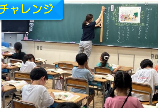
学習参観～いじめを考える～ 7/5 全学級でいじめについて考えを深める授業をしました。